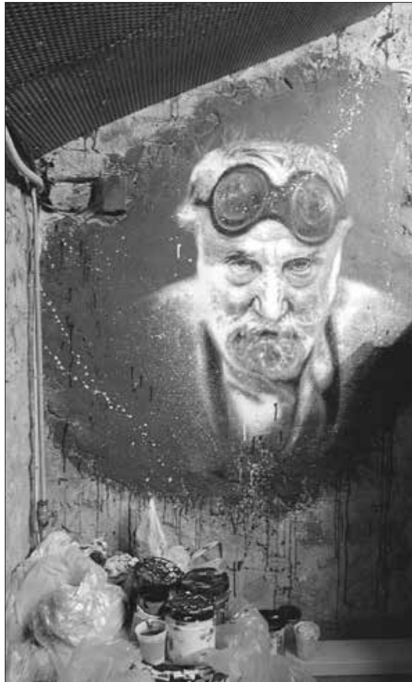
Un portrait de l'artiste

Le jeune garçon démontre vite qu'il sait se servir de ses mains. Il passe son temps à dessiner ou à fabriquer des carrioles pour les copains en assemblant des boîtes de conserves. On comprend alors qu'il n'est pas fait pour l'école, à moins