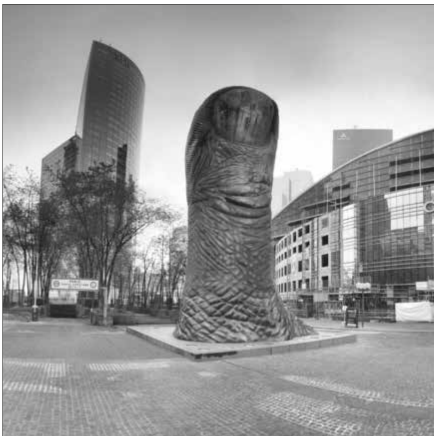
Le Pouce de César à la Défense (Paris)