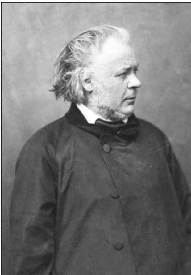
Honoré Daumier photographié par Nadar

Honoré Victorin Daumier naît le 26 février 1808 à Marseille. En 1814, la famille s'exile donc à Paris, mais si Honoré montre très vite des goûts artistiques, son père ne fera rien pour l'encourager, bien au contraire. Quoi de moins artistique que la profession d'huissier ? Or, c'est dans un de ces cabinets que le jeune Honoré va